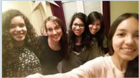
Noche de Chicas Februar 2016