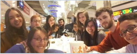
Kino & Abenessen