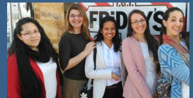
Hier sind meine mitbewohnerinnen vom Seminar ☺