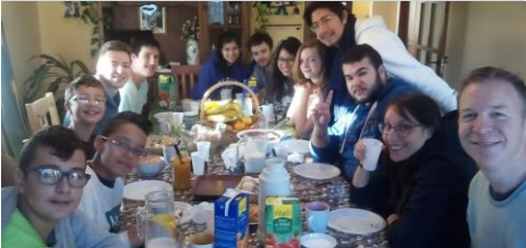
Jugendfreizeit vom 4-6/2015