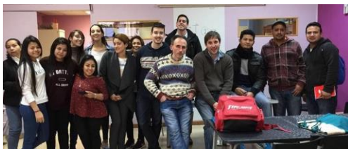
Sefovan País Vasco

Mit Studenten und Director vom Sefovan diurno Madrid